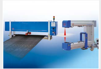
Systèmes de mesure et d'inspection pour les métaux, le plastique et le caoutchouc