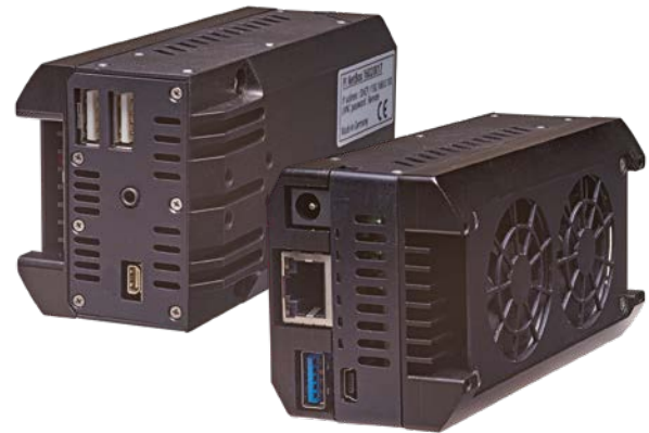
thermoIMAGER TIM NetBox